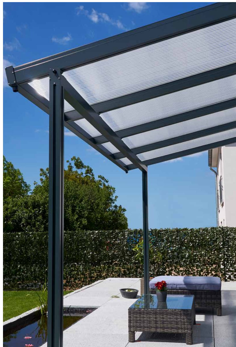
moderne attraktive Optik