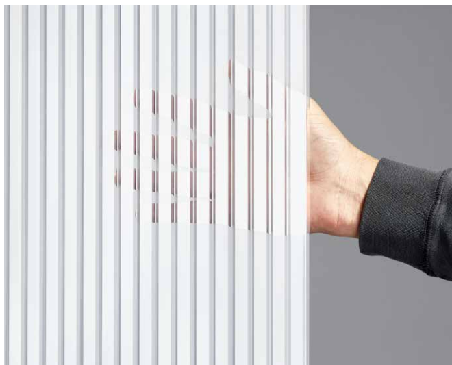
interessanter Sicht- / Lichteffect